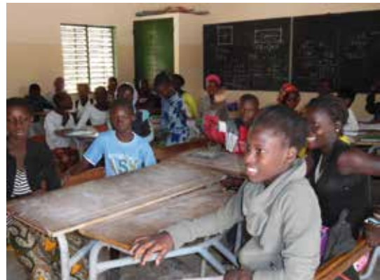
École de Djinack Bara au Sénégal

En automne 2017, l'ikl a introduit une demande de subside d'un projet de sensibilisation ou d'éducation au développement auprès du ministère de la coopération. Fin janvier 2018, l'ikl a reçu l'aval pour la réalisation du projet « Sénégalités » et ceci jusqu'au 31 décembre 2018. L'ikl travaille en collaboration avec Pharmaciens Sans Frontières qui sont présents depuis de longue date à Djinack Bara au sud du Sénégal.