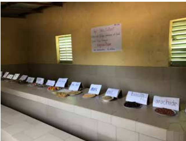
Exposition des ressources du milieu

Les enseignants ont organisé une exposition qui avait pour objectif de présenter la vie quotidienne du village. Le matériel exposé a été confié au personnel de l'ikl et sera utilisé lors des animations en automne 2018.