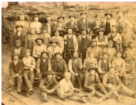
Minenarbeiter, 1914 © Retour de Babel – Di Genova Pascal.

beiteten oft als Saisonarbeiter im Bau. Zu Beginn des Winters kehrten sie nach Italien zurück und waren im Frühjahr wieder hier bei der Arbeit.