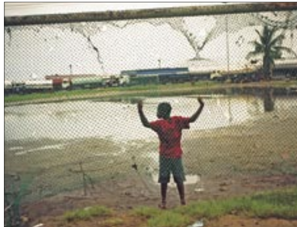
Kein Tor zur Freiheit: Vor den Abfüllstationen stehen die Tankwagen Schlange und träumt manch einer vom großen Spiel.