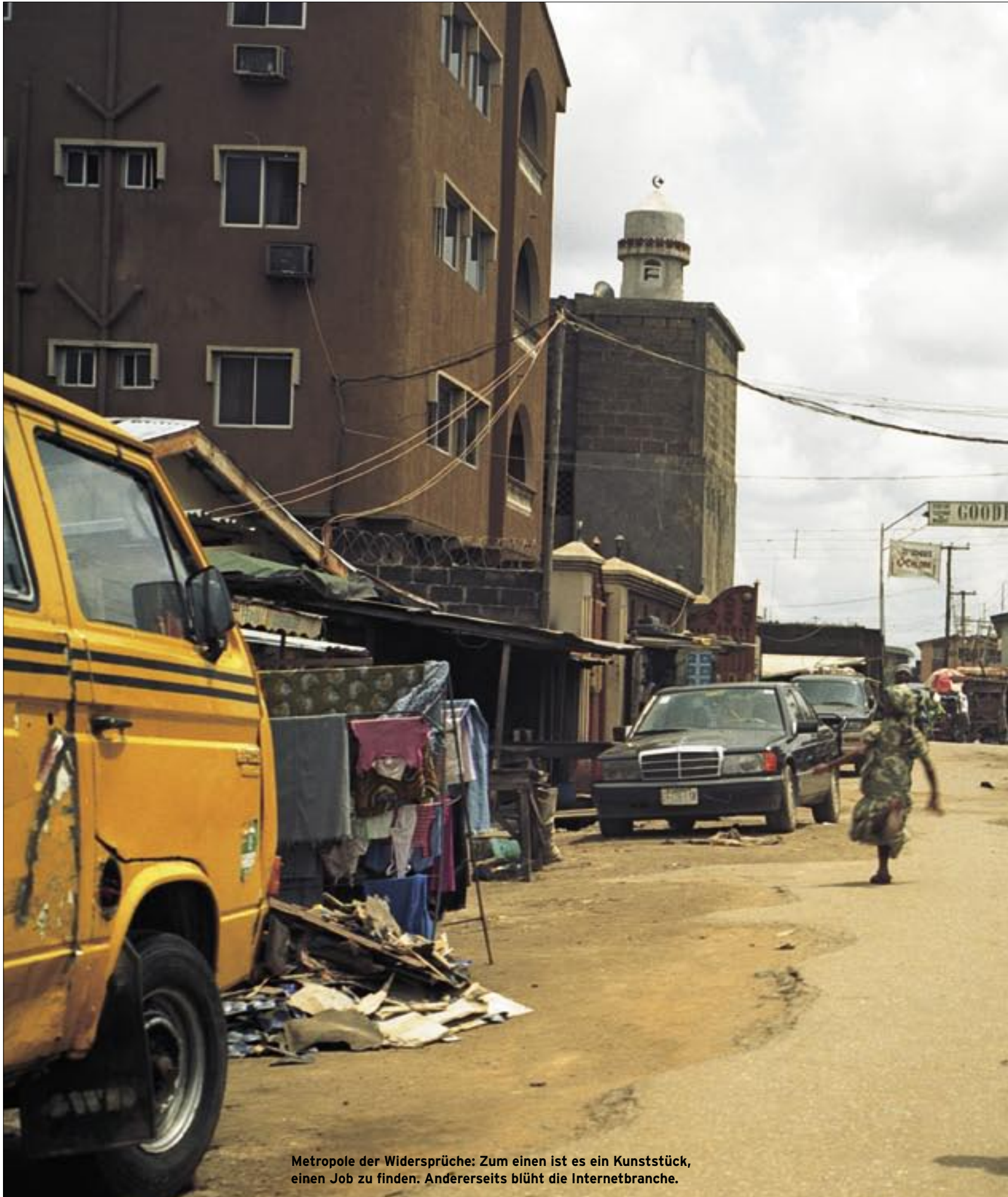
Metropole der Widersprüche: Zum einen ist es ein Kunststück, einen Job zu finden. Andererseits blüht die Internetbranche.