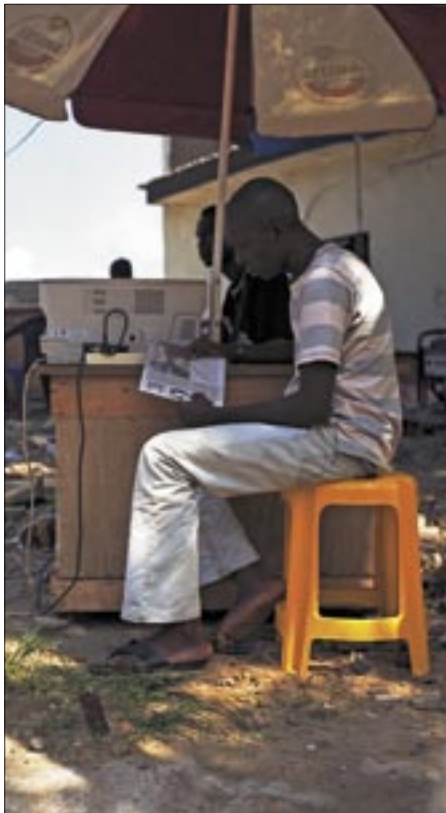
Flourierende Schattenwirtschaft: Der Großteil der Bewohner ist im informellen Sektor tätig - hier an einem Kopierstand.