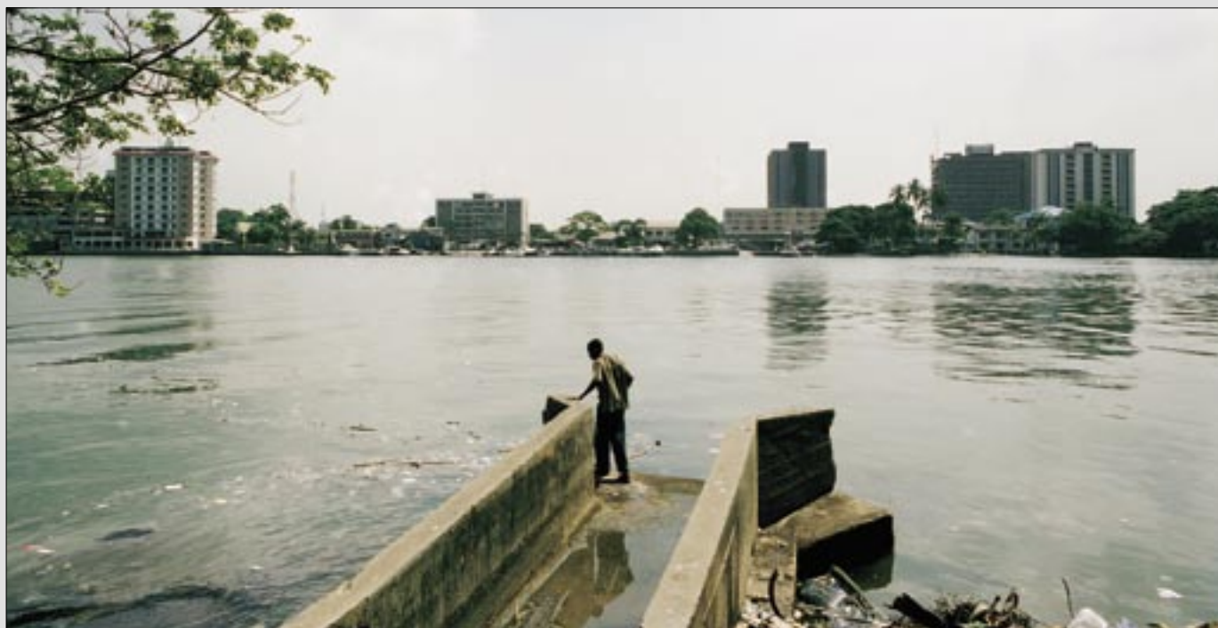
Perspektive Untergang: Nigeria befindet sich trotz (Schein-)Demokratie in einer Dauerkrise.

Auch die Situation im erdölreichen Nigerdelta ist von Gewalt geprägt: Sabotageakte auf Förderanlagen häuften sich, nahezu täglich wurden Mitarbeiter ausländischer Firmen gekidnappt, die meisten jedoch gegen Lösegeld wieder freigelassen. Neben den zwei größten Rebellengruppen, die für eine Beteiligung der Bevölkerung an den Gewinnen aus den Ölgeschäften kämpfen, sind etwa 20 weitere bewaffnete Organisationen und Banden aktiv. Mehrere Erdölfirmen haben ihre Mitarbeiter evakuiert. Seit Jahren beuten ausländische Konzerne die Erdölreserven im Nigerdelta gegen Lizenzgebühren der Regierung aus. Etwa 90 Prozent der Exporteinnahmen stammen aus der Ölförderung, die zu schweren Umweltschäden geführt hat. Pipelines verlaufen durch Dörfer und Äcker, Wasser und Luft sowie Grundnahrungsmittel sind verseucht. Erst kürzlich explodierte wieder eine Benzinpipeline. Mehr als hundert Menschen starben. Treibstoffdiebe hatten die Leitung angebohrt. ■