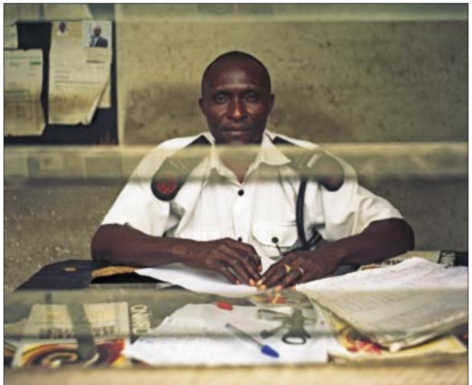
Wärter für Bessergestellte: Der Wachmann eines privaten Sicherheitsdienstes ist für den Schutz der Bewohner einer «gated community» zuständig.