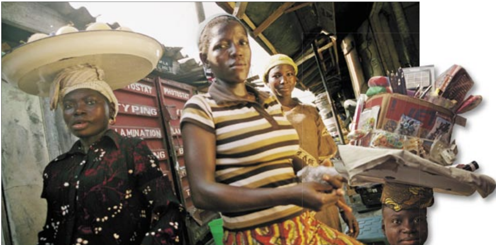
Das Leben ein Markt: Auf dem Markt wird alles Erdenkliche feilgeboten, die Frauen arbeiten mit Köpfchen.