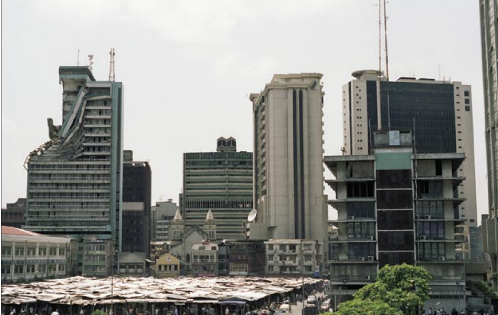
Symbol für Pfusch: Das Gebäude der «Bank of Industry» stürzte ohne äußere Einwirkung in sich zusammen.