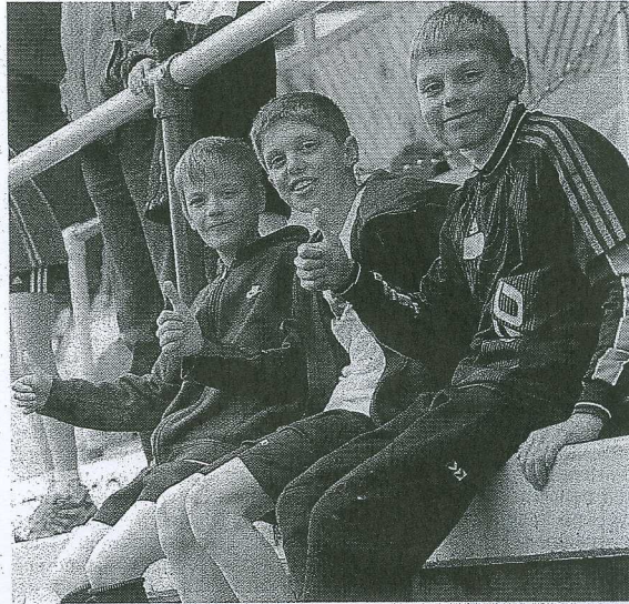
... et le spectacle a été très apprécié.