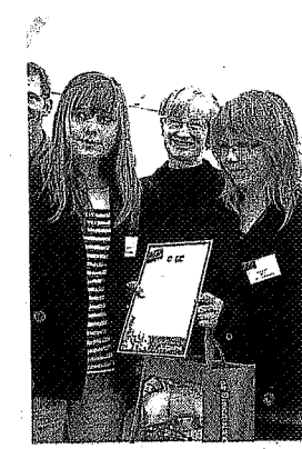
Réunion au château de Senam...