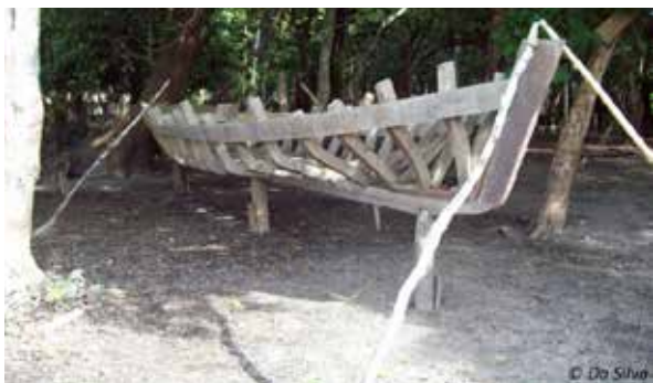
Construction d'une pirogue