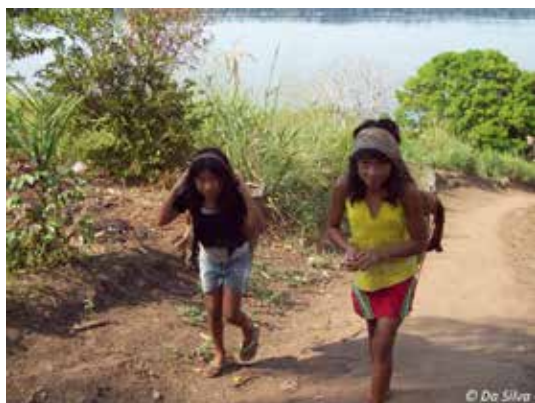
Les jeunes filles reviennent de la récolte