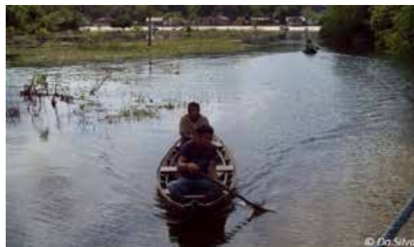
Les hommes dans la pirogue. Derrière eux, on aperçoit le village.