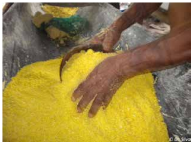
Préparation de la farine de manioc