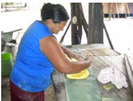
Préparation du repas