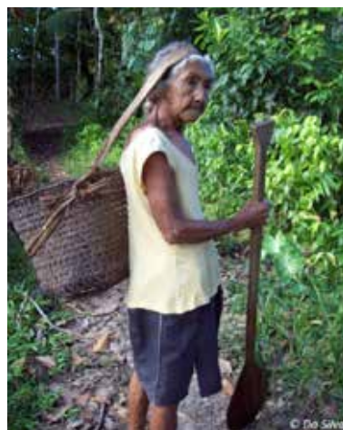
Une des anciennes du village va travailler dans la forêt